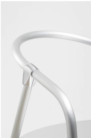
Klemens Schillinger, Hardware, 2020.